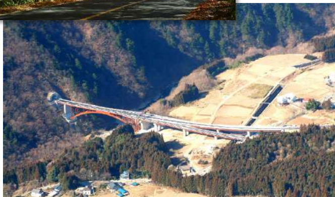
日塩 龍王峡ライン