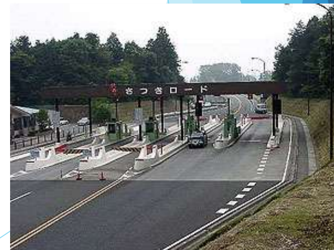
宇都宮鹿沼道路「さつきロード」