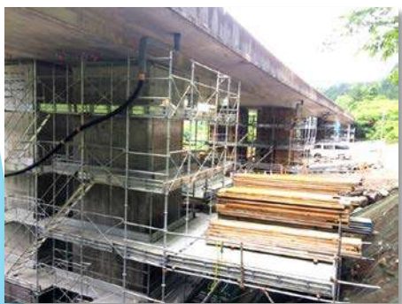
日光宇都宮道路 安良沢大谷橋 橋梁補修工事