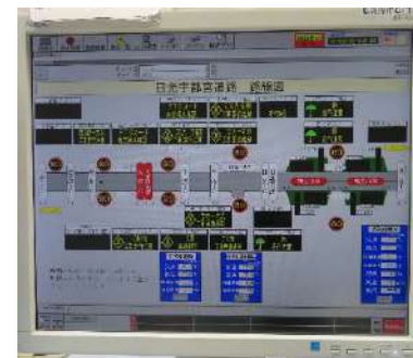
情報板の制御状況