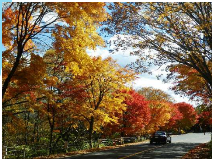
日塩 もみじライン