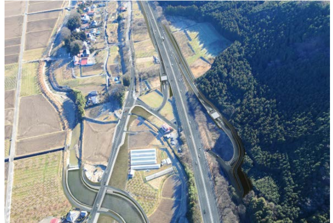
日光宇都宮道路と篠井インターチェンジ